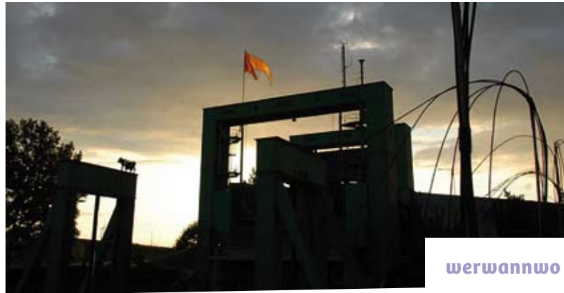
Schiffshebewerk Rothensee: 100 Tage – 12 Nächte LA NOTTE ... VOR ANKER